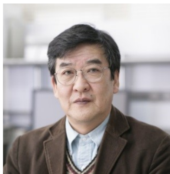
室蘭工業大学 名誉教授 (社)新住協代表理事